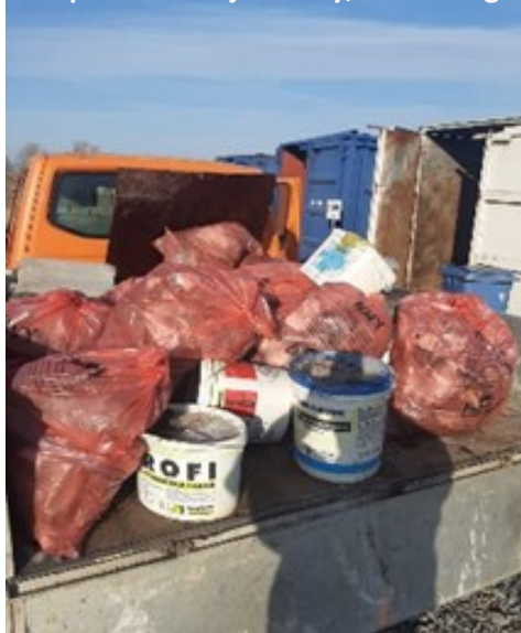
Odpad z čiernej skládky, cca 400 kg